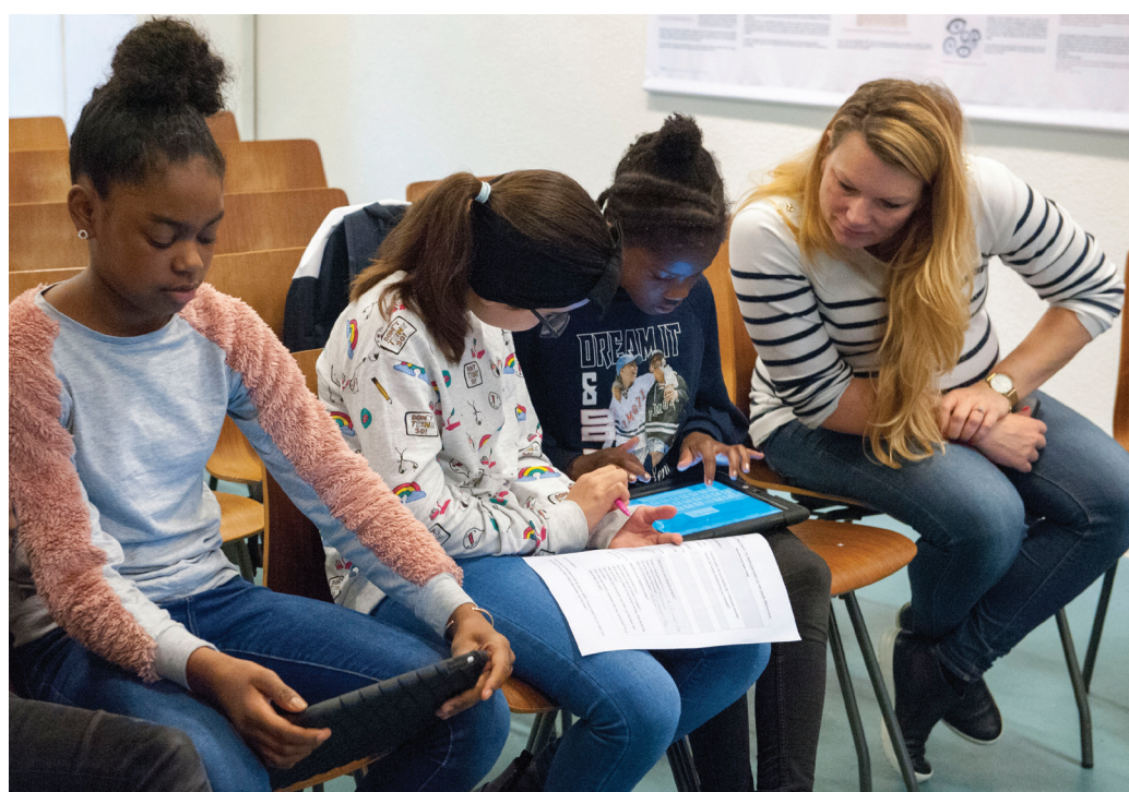
OBS De Toekomst werkt met Wordt gemist .

Wordt gemist is geschikt voor het basis- en voortgezet onderwijs, voor leerlingen vanaf 10 jaar. Door gebruik te maken van een online klikplaat over het joodse leven voor en tijdens de oorlog en met verschillende lesplannen, doorlopen leerlingen drie stappen: zoek, verbind en herdenk. Ze maken daarbij gebruik van het online Joods Monument en werken toe naar een eigen vorm van herdenken.