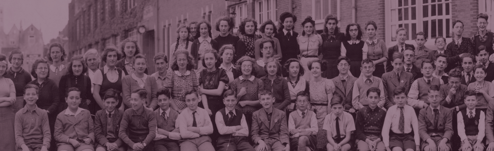
Leerlingen en leraren van de Joodsche HBS in Amsterdam, 1941.